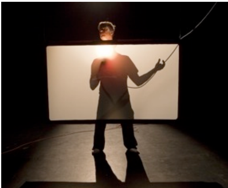
Akinétopsie par Kalle Nio